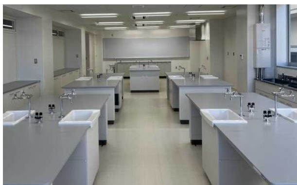
内観（微生物実験室）