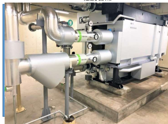
地下階 長寿命化更新設備機器