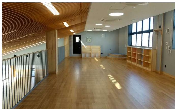
内観（多目的スペース）