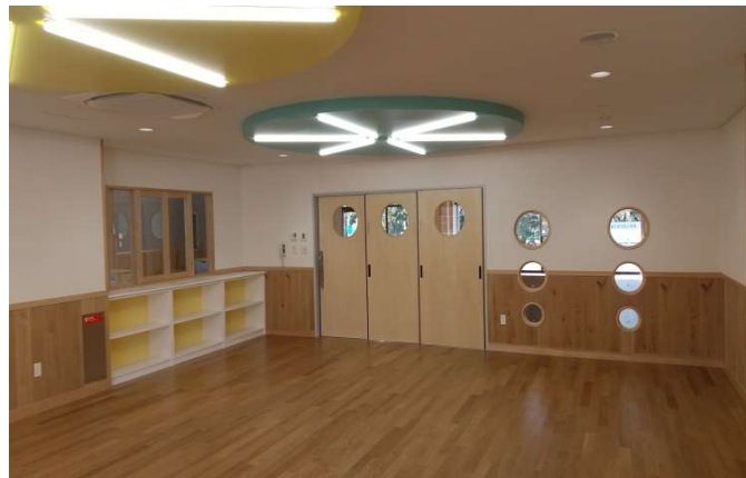
内観（子育て支援センター）