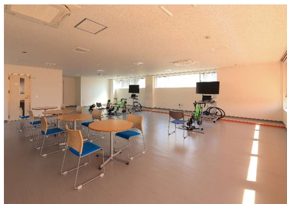
内観（2階バーチャルライド）