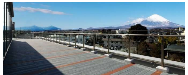
富士山展望デッキ