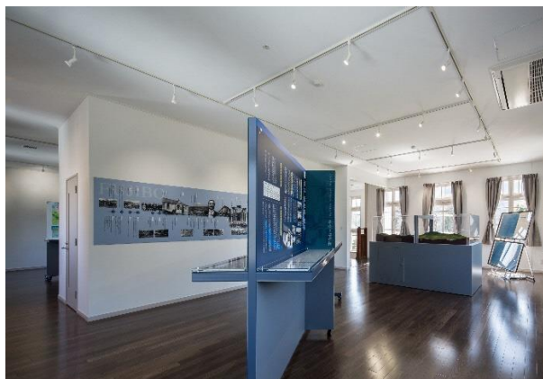
2階 展示ギャラリー