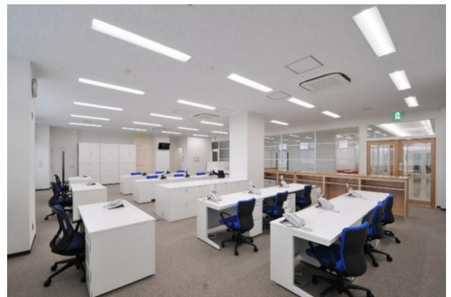
内観（消防本部事務室）