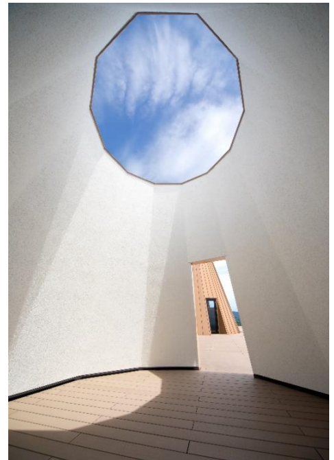
内観（スカイテラス）