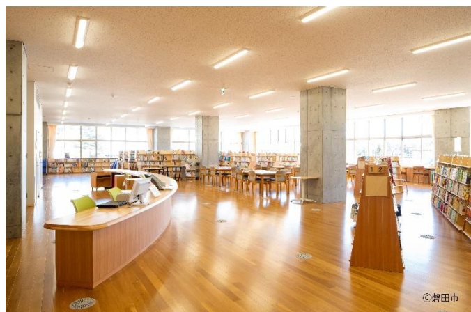
内観（ながふじ図書館）